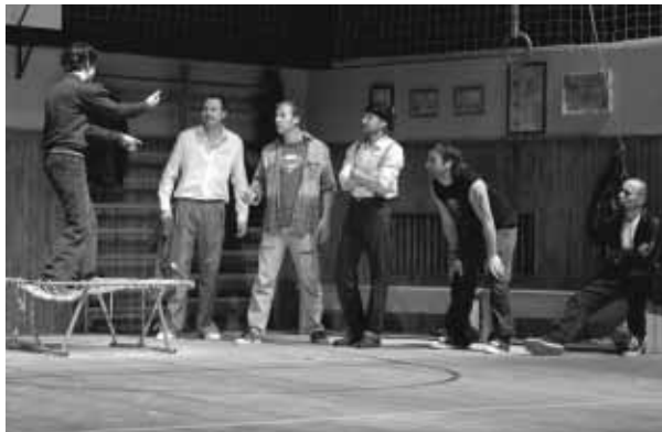
Protagonisti najnovšej komédie DAB s názvom Šoumeni.