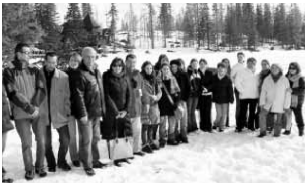
Spoločná fotografia účastníkov projektu Comenius zo zasnežených tatranských kopcov.