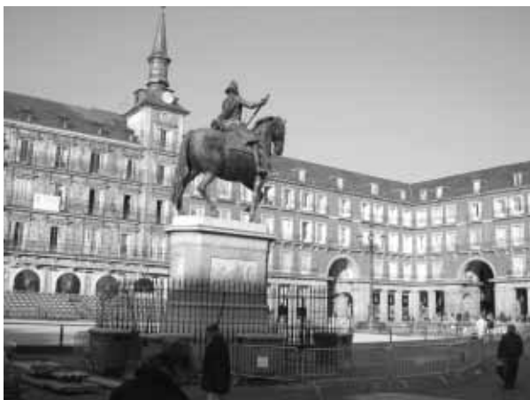
Plaza de Mayor s jazdeckou sochou Filipa III. nám pripomína Viedeň, pretože námestie bolo budované v období pôsobenia Habsburgovcov v Španielsku.