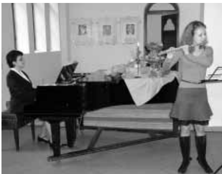
Kultúrny program pripravila ZUŠ Jozefa Rosinského v Nitre.