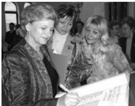
Ocenené učiteľky sa zapísali do Pamätnej knihy mesta.